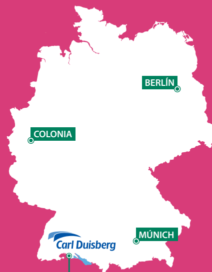
RADOLFZELL EN EL LAGO DE CONSTANZA

Carl Duisberg Centren es su escuela de confianza para programas formativos de alta calidad en Alemania, por ejemplo en Radolfzell en el lago de Constanza, cerca de Suiza. Nuestros cursos intensivos de alemán y variados programas le ofrecen un eficiente aprendizaje de lenguas. El servicio completo que le brinda nuestro experimentado equipo permite a los niños y jóvenes de entre 11 y 17 años disfrutar de cursos llenos de aventuras en vacaciones y de estancias escolares durante varios meses.